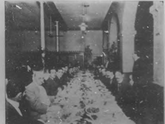
EL BANQUETE DE LOS REPORTERS GRAFICOS.—Otro aspecto de la mesa.