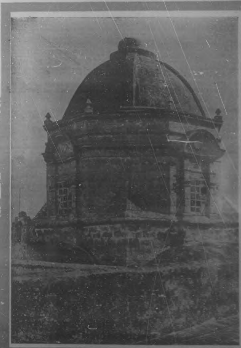
Habana Artística—Cúpula de la Iglesia de San Francisco.