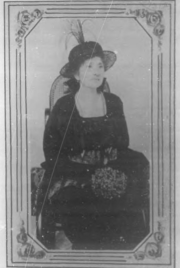
SRA. BLANCHE Z. DE BARALT Ilustre escritora

Había discos de varios tamaños, medias lunas, estrellas y cometas. Había diminutos arcos y flechas; tórtolas tranquilas y golondrinas al vuelo, y hasta un coche real con cuatro caballos, admirablemente recortado en el