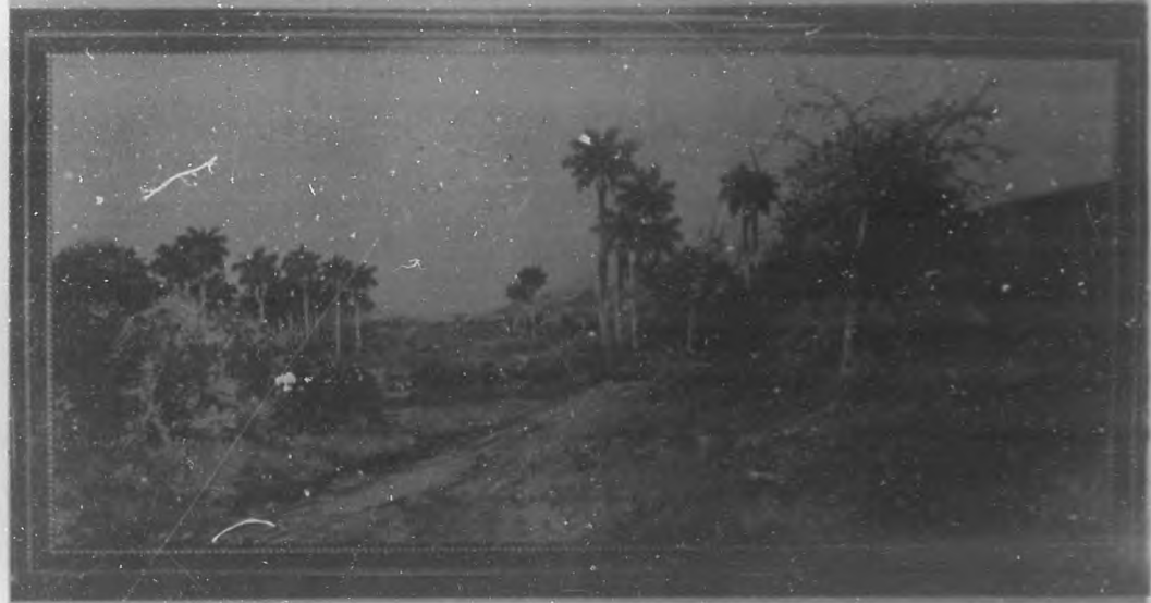
CUADRO DE A. R. MOREY