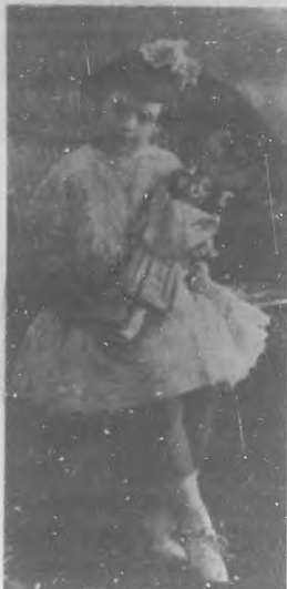
Carmelina Zafra y Pérez-Castañeda