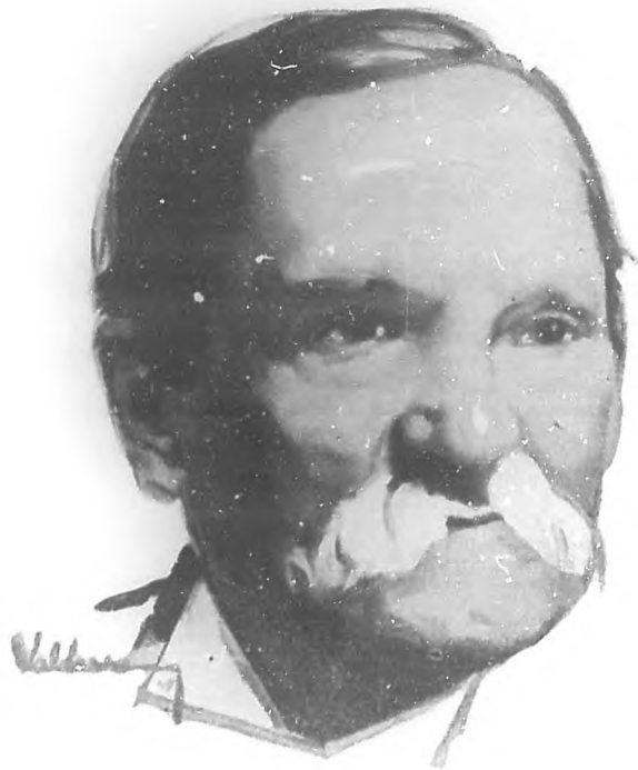
TOMAS ESTRADA PALMA (1853-1908)